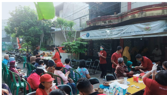
Gambar 5.1 Kegiatan penyuluhan perilaku hidup sehat dimasa lansia

Setelah kegiatan pengukuran, Lansia diberikan kuesioner mengenai polahidup sehat dimasa lansia. Setelah mengisi kuesioner, dilakukan penyuluhan Kesehatan terkait pola hidup sehat di masa lansia. Lansia dijelaskan mengenai perubahan- perubahan yang terjadi pada masa lansia serta Tindakan yang dapat dilakukan agar tetap dapat mempertahankan Kesehatan secara optimal. Lansia diberikan leaflet yang dapat dibawa pulang, sehingga dapat lebih mempertahankan pengetahuan yang telah mereka dapatkan. Setelah kegiatan penyuluhan, dilanjutkan dengan kegiatan tanya jawab. Antusia lansia untuk bertanya sangat tinggi. Hal ini dapat terlihat dari banyaknya pertanyaan yang diajukan oleh lansia terutama mengenai penyakit yang sedang diderita saat ini. Lansia juga bertanya terkait cara yang dapat dilakukan untuk mengatasi keluhan yang sering muncul pada masalansia. Diakhir kegiatan, lansia dievaluasi lagi terkait pengetahuan mengenai pola hidup sehat dimasa lansia.