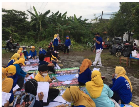
Gambar 1. Kegiatan Penyuluhan kesehatan

Kegiatan pendidikan kesehatan dilakukan pada tanggal hari sabtu tanggal 26 Juni 2021 pada pukul 07.00- 08.00 WIB di balai RW 3 Kelurahan Kebraon Kecamatan Karang Pilang Surabaya. Kegiatan penyuluhan bertepatan dengan kegiatan posyandu lansia yang rutin dilaksanakan setiap minggu di wilayah ini. Kegiatan dihadiri oleh sebanyak 20 orang ibu.