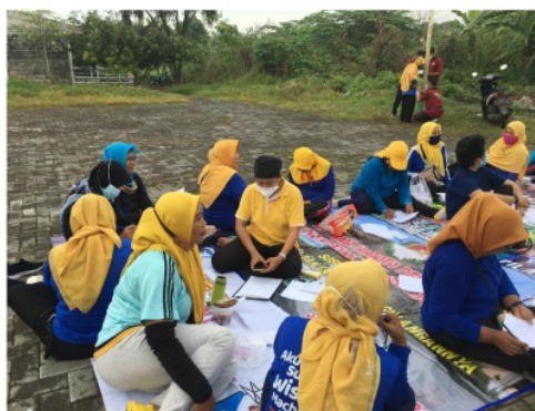
Gambar 2. Kegiatan diskusi saat penyuluhan kesehatan

Acara penyampaian materi dilakukan selama 15 menit, kemudian dilanjutkan dengan diskusi dan tanya jawab. Setelah diberikan pendidikan kesehatan, dilakukan pengukuran tingkat pengetahuan remaja mengenai Eco-Enzyme dan didapatkan hasil, sebagian besar ibu yaitu sebanyak 70% ibu memiliki pengetahuan yang baik mengenai pengolahan limbah dan Eco-Enzyme . Para sudah paham dan mengerti tentang materi yang diberikan.