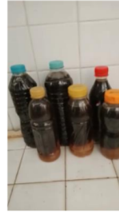
Gambar 3. Hasil eco-enzyme yang sudah jadi

Setelah 90 hari eco- enzyme dapat dipanen dan diletakkan di botol plastic. Eco- enzyme yang baik akan berwarna kecoklatan jernih dan berbau asam segar. Eco-enzyme dapat digunakan untuk beberapa keperluan rumah tangga seperti pupuk tanaman, mengepel lantai, mencuci, mencegah penyumbatan saluran air, dan lain-lain. Pada akhir acara, para ibu diberi contoh Eco-Enzyme yang sudah selesai dibuat.