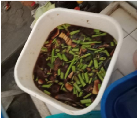
Gambar 3. Hasil pencampuran ecoenzyme

bahan eco- enzyme yang sudah disediakan dijadikan 1 pada wadah yang tertutup rapat. Fermentasi Eco-Enzyme dilakukan selama 90 hari (3 bulan).