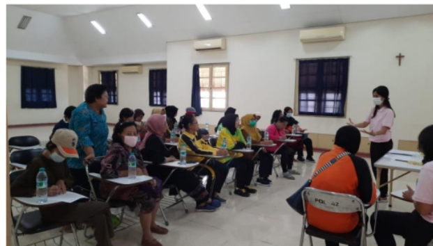
Gambar 7. Sosialisasi Strategi Koping

Pada hari sabtu tanggal 9 September 2023 dilakukan sosialisasi terkait strategi koping pada penderita DM. Kegiatan ini dilakukan karena banyak penderita DM yang mengalami kesulitan mengontrol stress terutama dalam menjalankan pengobatan DM.