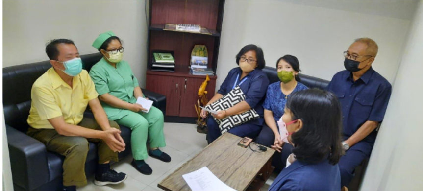
Gambar 1 : Pertemuan dengan Mitra

Pada hari Kamis tanggal 27 Juli juga dilakukan FGD terkait pembuatan sepatu dan insole sepatu yang akan digunakan oleh penderita DM. Dalam kegiatan tersebut didiskusikan terkait desain, ukuran serta bahan yang akan digunakan dalam pembuatan sepatu dan insole. Sepatu yang digunakan adalah sepatu bertali dengan jenis kanvas. Sepatu dibuat tidak ada sol dalam dan dibuat datar. Sedangkan insole terbuat dari bahan sponge ethylene vinyl acetate (EVA) super dan kain bludru. Kelebihan dari bahan tersebut adalah memiliki fleksibilitas yang baik serta nyaman dipakai.