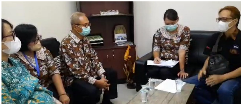
Gambar 2. Pertemuan dengan pembuatan sepatu dan insole sepatu

Pada hari Kamis tanggal 27 Juli juga dilakukan FGD terkait pembuatan sepatu dan insole sepatu yang akan digunakan oleh penderita DM. Dalam kegiatan tersebut didiskusikan terkait desain, ukuran serta bahan yang akan digunakan dalam pembuatan sepatu dan insole. Sepatu yang digunakan adalah sepatu bertali dengan jenis kanvas. Sepatu dibuat tidak ada sol dalam dan dibuat datar. Sedangkan insole terbuat dari bahan sponge ethylene vinyl acetate (EVA) super dan kain bludru. Kelebihan dari bahan tersebut adalah memiliki fleksibilitas yang baik serta nyaman dipakai.