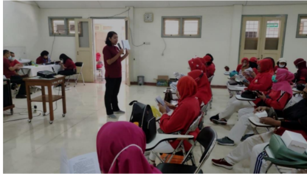
Gambar 6. Pelatihan Penatalaksanaan DM

penggunaan obat DM serta kontrol secara rutin. Dalam kegiatan tersebut penderita diberikan buku Modul Patuh Diabetes Melitus. Dalam modul tersebut terdapat informasi yang dapat dibaca penderita DM terkait DM serta penatalaksanaannya. Modul tersebut dapat juga dipakai sebagai alat untuk meningkatkan kepatuhan penderita dalam menjalankan diet, olah raga, minum obat serta pemantauan kadar gula darah secara rutin. Kegiatan pelatihan penatalaksanaan DM dihadiri oleh 30 peserta PDHS. Peserta tampak antusias dalam mendengarkan materi yang disampaikan oleh tim PKM.