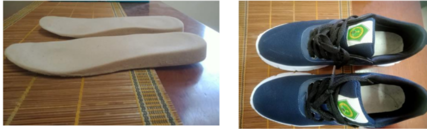
Gambar 3 : Insole sepatu dan Sepatu