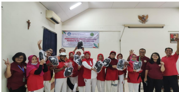
Gambar 5 : Pembagian sepatu dan insole sepatu