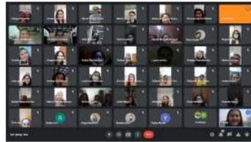
Gambar 2. Dokumentasi Kegiatan Pendidikan Kesehatan Cedera Otot Rangka Remaja Putri Emaus

peningkatan pengetahuan remaja putri asrama Emaus setelah dilakukan edukasi.