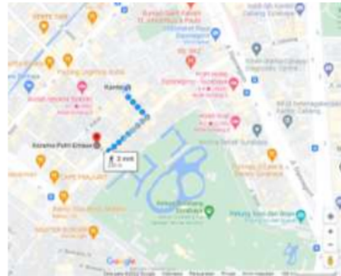
Gambar 1. Peta Lokasi Mitra

Pendidikan kesehatan pada remaja tentang P3K menjadi salah satu tantangan untuk terus dikembangkan, karena menjadi bagian dalam pembentukan ketahanan individu maupun masyarakat. Permasalahan cedera sistem otot rangka sering dijumpai kapan saja, dimana saja. Kegiatan ini merupakan satu paket series dari pengabdian masyarakat sebelumnya tentang cedera jaringan lunak. Kedua hal ini penting diberikan dikarenakan kondisi cedera dapat terjadi pada kasus cedera lunak maupun cedera sistem otot rangka. Mitra pada kegiatan ini adalah remaja yang tinggal di asrama putri emaus Jl. Ciliwung 68, Darmo, Surabaya. Seluruh remaja yang tinggal di asrama adalah perempuan.